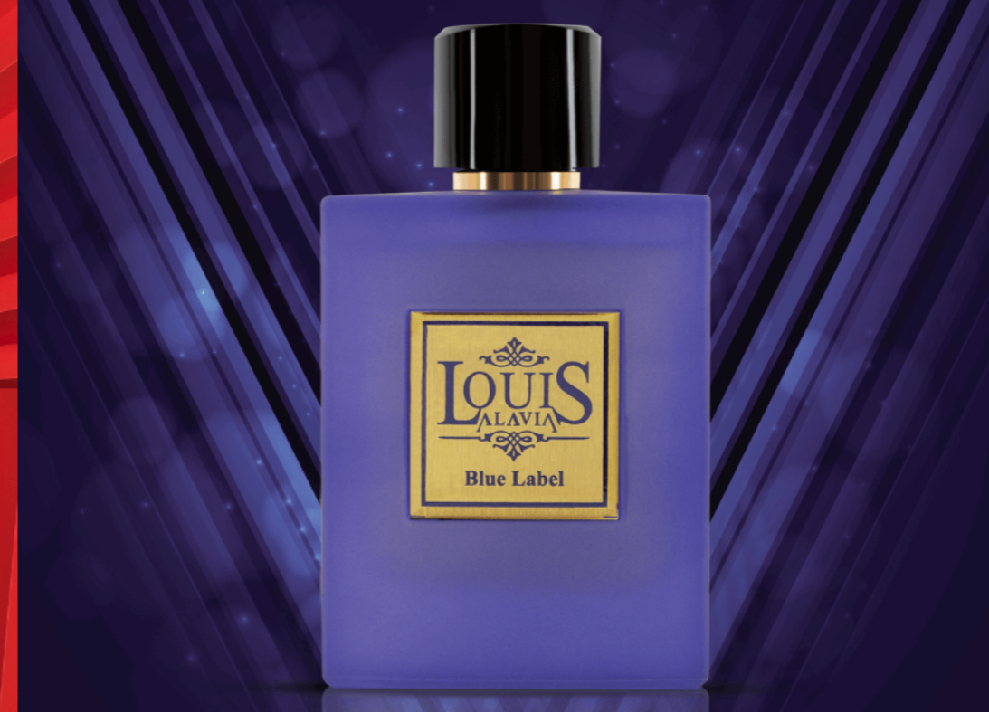
LOUIS ALAVIA Blue Label

عطر لوئیس آلاویا رژ رایحه ای گرم و شیرین و تند دارد و در گروه بویایی شرقی ، چوبی دسته بندی میشود در هرم بویایی این عطر زنانه آکوردهای روایح چوبی ، ادویه جات گرم ، وانیل ، بالزامیک ، ادویه های تازه و دارچین وجود دارد که خوشبو شدن این عطر کمک میکنند این عطر سلطنتی و جذاب پخش بو و ماندگاری بسیار خوبی دارد و برای استفاده در فصول پاییز و زمستان برای میهمانی های شبانه و مجالس رسمی گزینه ی بسیار خوبی به شمار می آید